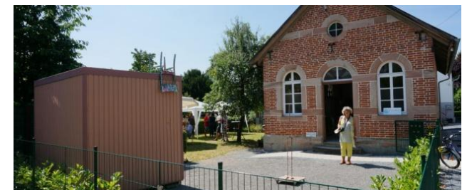
Kunstverein 71546 Allmersbach am Weinberg Kapellenweg 5

Workshops für Kinder, Jugendliche und junge Erwachsene aller Einwohner der Gemeinden Aspach, Burgstetten und Backnang.